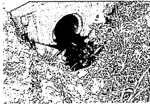
Trabajos en Fray Casiano