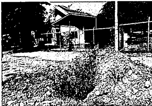
Frente a la Iglesia de Chomes, alcantarillas cubiertas