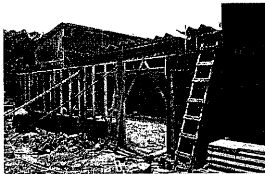
Anexo al edificio comercial